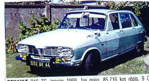
RENAULT R16 TS, janvier 1969, 1re main, 85.716 km réels, 9 CV, peinture bleu 440, vitres élec., état mécanique et carrosserie exceptionnel, couche garage, CG collection. Prix: 30.000 F à débattre - Tél. 02 40 22 44