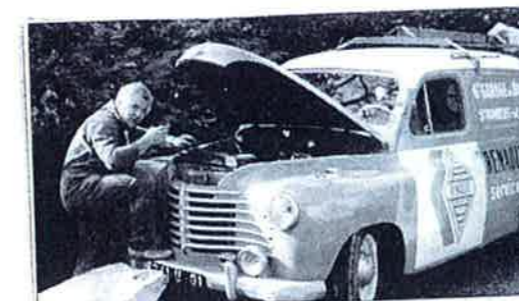
RENAULT Prairie dépanneuse, 1952, 14 CV, à restaurer, cause manque de place, plateau à prévoir. Prix: 228 €, livraison possible rayon 100 km (supplément). Tél. 04 74 36 28 17 (Dpt 01).