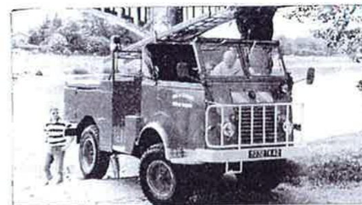
RENAULT R2087 4x4 camion citerne, 1962, pompiers Feux & Forêts, rouge, permis VL, superbe état. Prix: 2.286 €. Tél. 04 77 10 09 60 (Dpt 42).