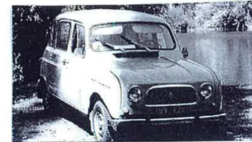
RENAULT R4 L Super, 1963, 81.000 km complez, bon état, CT OK, vendue cause familiale et double emploi. Prix: 7.500 F - Tél. 05 63 38 11 98 ou (HR) 06 83 74 35 34 (Dpt 81).