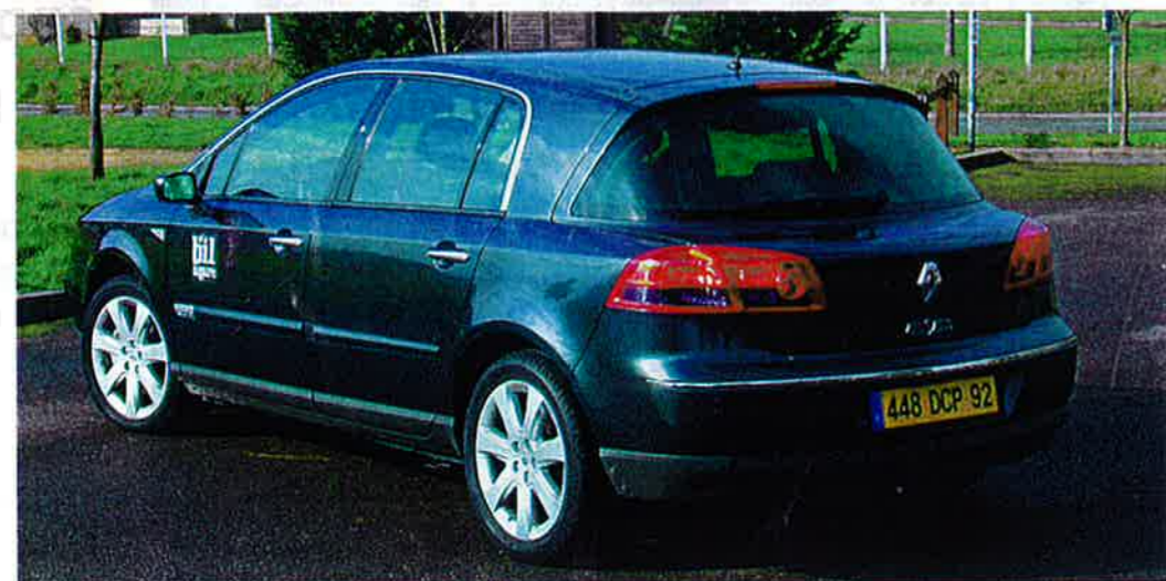
Vel Satis ser inte ut som andra bilar och den drar blickarna till sig. Bilen har också kvaliteter som gör den mycket intressant i prestigesegmentet.