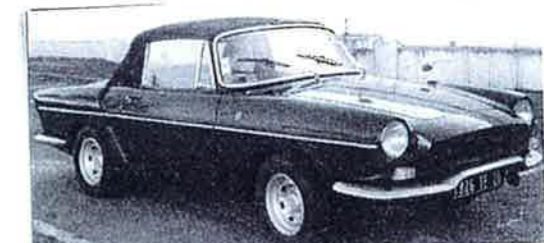
RENAULT Caravelle 1100, 1967, entièrement restaurée, boîte 4, freins à disques, int. simili cuir noir. Prix: 7.400 €, reprise ou échange possible. Tél. 01 69 52 92 34 ou 06 18 96 31 73 (Dpt 91).