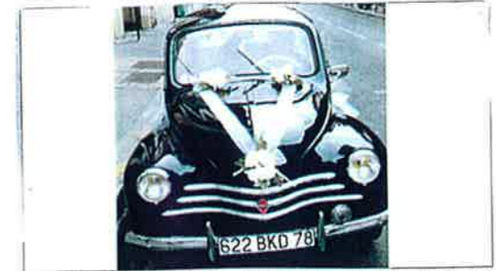
RENAULT 4 CV luxe, 1959, moteur reconditionné à neuf, sellerie neuve, peinture neuve d'origine, (C.G. française), CT OK, cause déménagement. Prix: 4.421 €. Tél. 01 30 95 86 46 le soir ou 06 18 81 38 57 (Dpt 78).