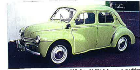
RENAULT 4 CV, 1958, restaurée, TBE. Prix: 25.000 F. Plusieurs modèles en stock. R.A.R., RN 89 - 63190 Lezoux Tél. 04 73 68 29 90 - Fax. 04 73 68 24 38 - E-mail : R.A.R.@wanadoo.fr